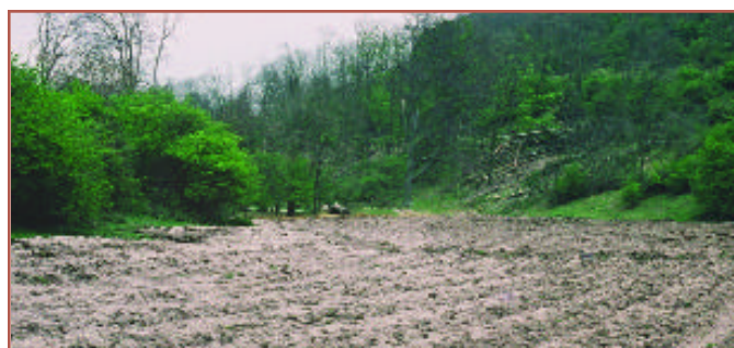
Troi tir glas niwtral cyfoethog mewn rhywogaethau