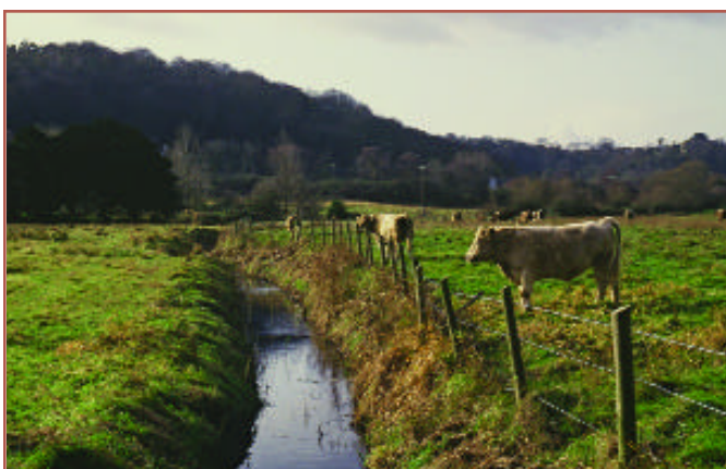
Gwartheg dwysedd isel yn pori tir glas cyfoethog mewn rhywogaethau